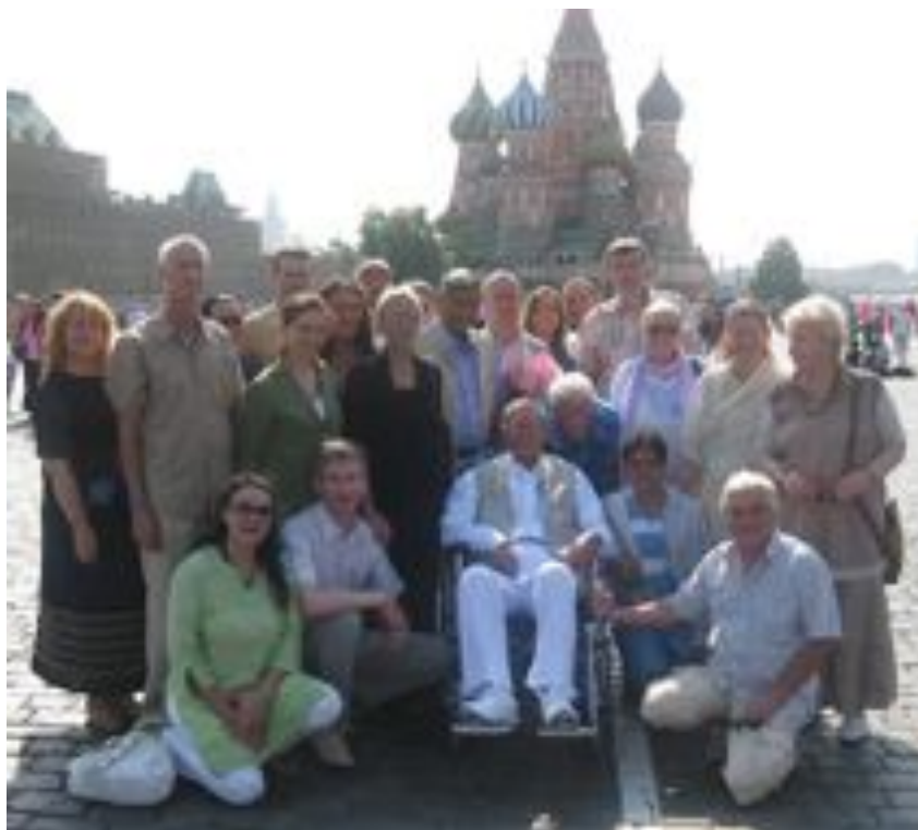
Shri Muniraj et compagnie sur la place rouge

Ce fut merveilleux, inspirant et véritablement un miracle que Shri Muniraj soit venu en Russie, ait présidé la Yagna de 6 jours et passé 10 jours en compagnie des dévots ici.