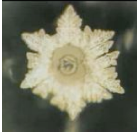
« Faisons-le ensemble »