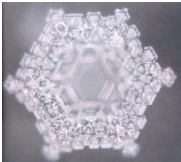
Om Namah Shivaya

Pour en savoir plus : http://www.masaru-emoto.net/