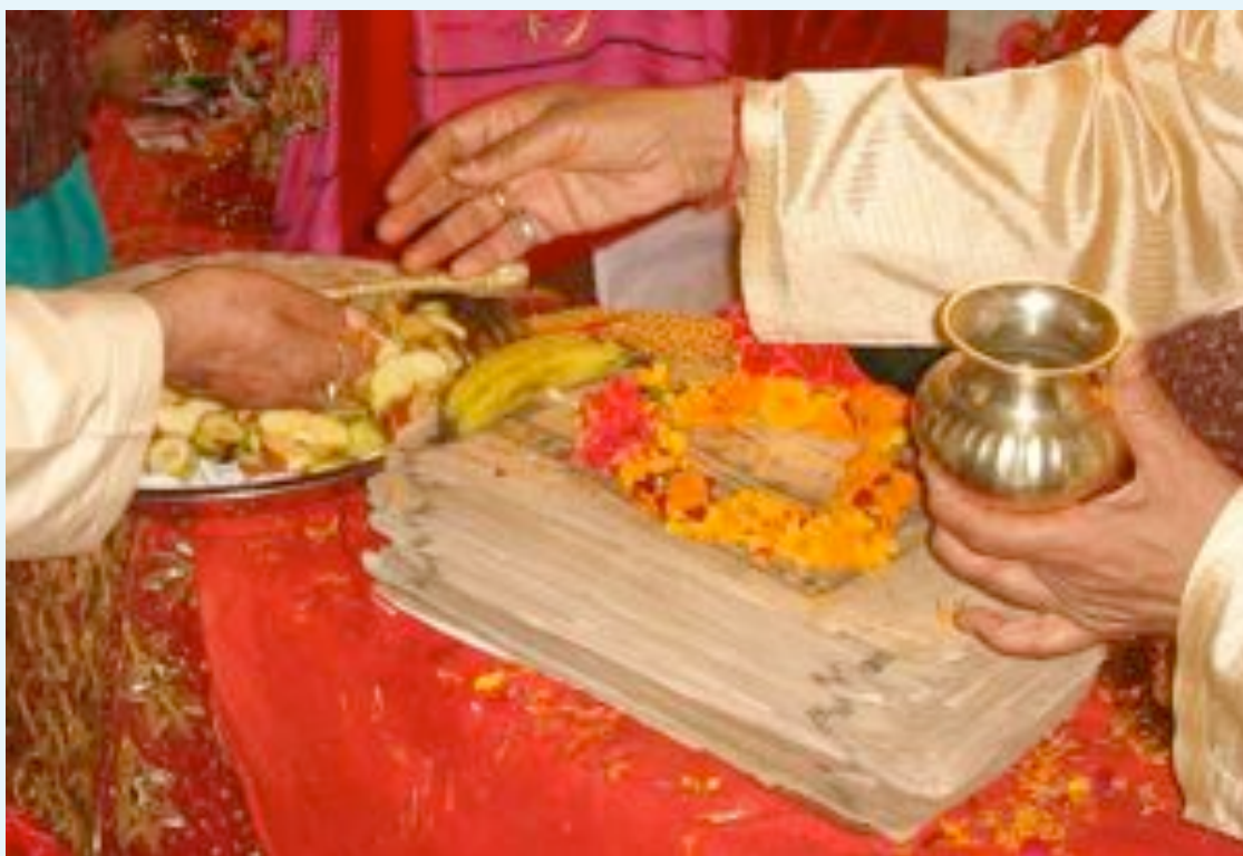
La Puja à la DEVI s'est déroulée avec un grand succès