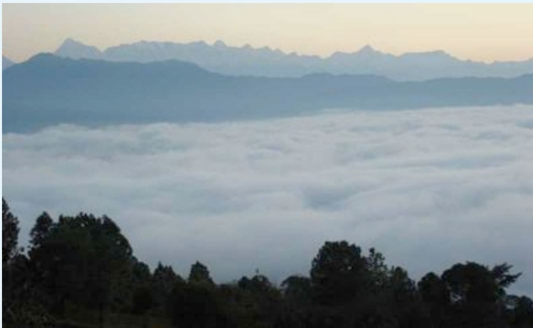
Gloire du matin dans l'Himalaya à l'Anand Puri Ashram

Voici quelques moments des célébrations de Chilianaula :