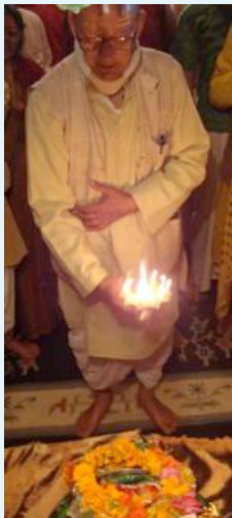
Offrant la Lumière au Seigneur