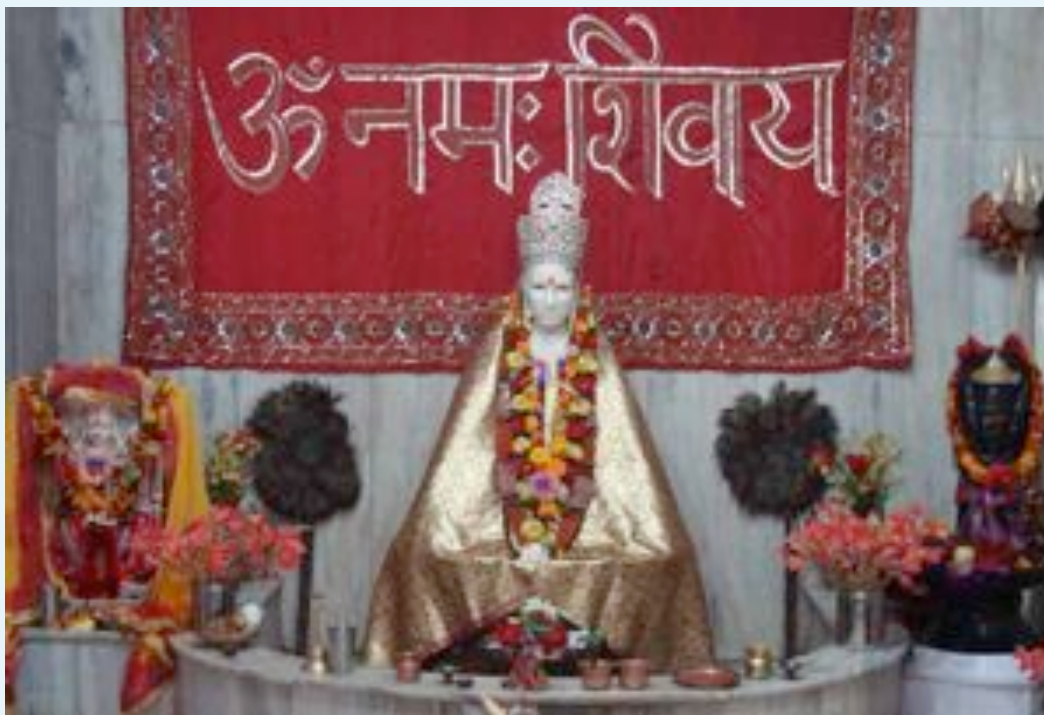
Recevez le Darshan