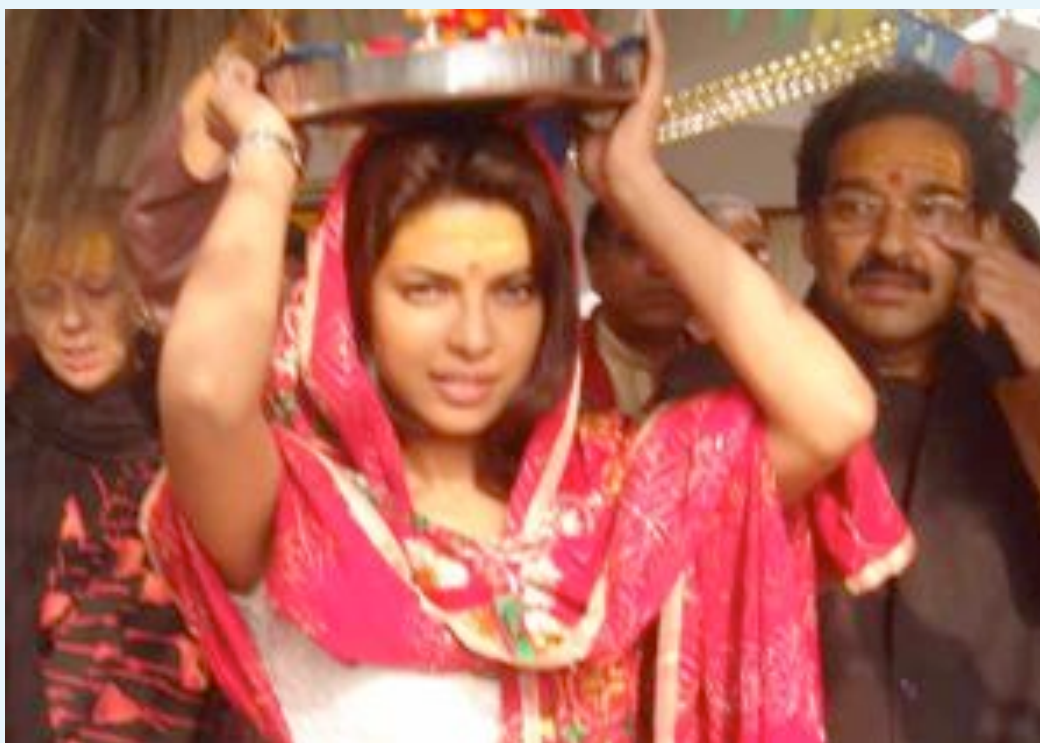
Miss Univers est venu un jour porter le SEIGNEUR de l'Univers sur sa tête.