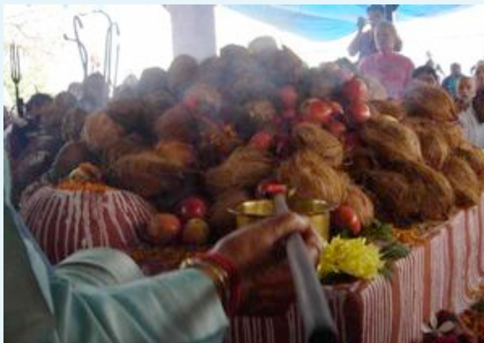
Un bref aperçu de cette puissante Yagya de 9 jours à l'Omnipotente Mère Divine DURGA