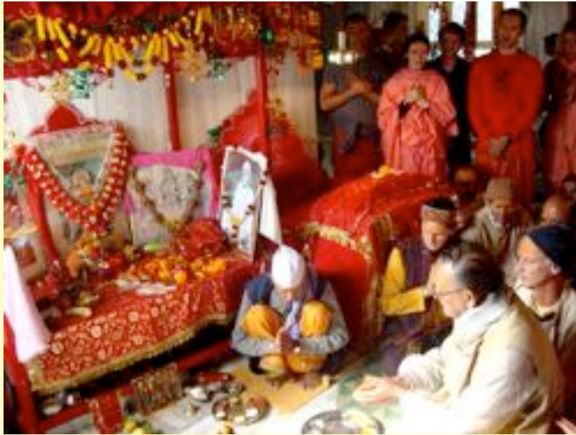
La Puja à la Mère Divine a été menée de la façon preste habituelle.