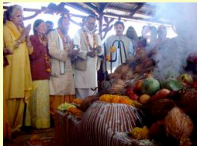
La Maha Yagna, le temps fort de la Navaratri, était Divine, comme elle l'est toujours.