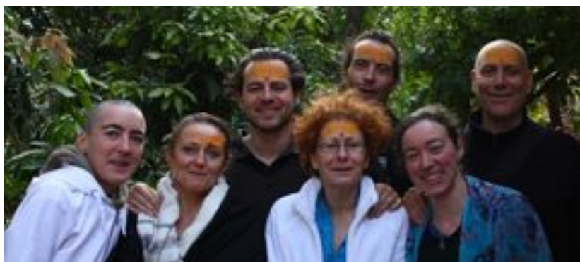
Groupe de Français à Hairakhan