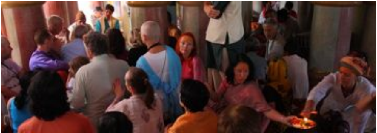
Après une pause au dhuni pour les Padukas, la traversée de la Gautama Ganga :