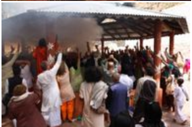
et enfin l'aarti du soir :