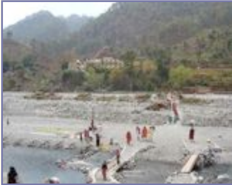
Herakhan Vishwa Mahadham

Un peu de pluie les premiers jours a rafraîchi la température déjà élevée, mais la plupart des journées étaient juste parfaites. Voici quelques images pour vous donner un aperçu du merveilleux moment que nous avons passé ici.